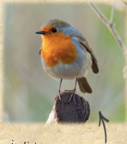
individu avec son plumage d'adulte

Quelques infos : de la famille des Muscicapidés, le rougegorge est un petit oiseau rondelet facilement reconnaissable par sa couleur orange vive sur le devant du corps qui lui donne son nom. Insectivore à la belle saison il n'hésite pas à changer en hiver pour adopter un régime riche en baies. Ce petit oiseau solitaire et très territorial n'est pas farouche pour un sou. Facile à contempler il fait le bonheur de ses observateurs.