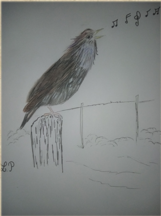
L'étourneau interprété par Prescilla Lemesle

Elle nous apprend que l'étourneau « pisote » quand ce grand imitateur fait des vocalises